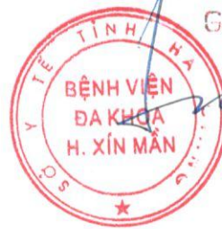
BsCKII. Vương Tiến Lương